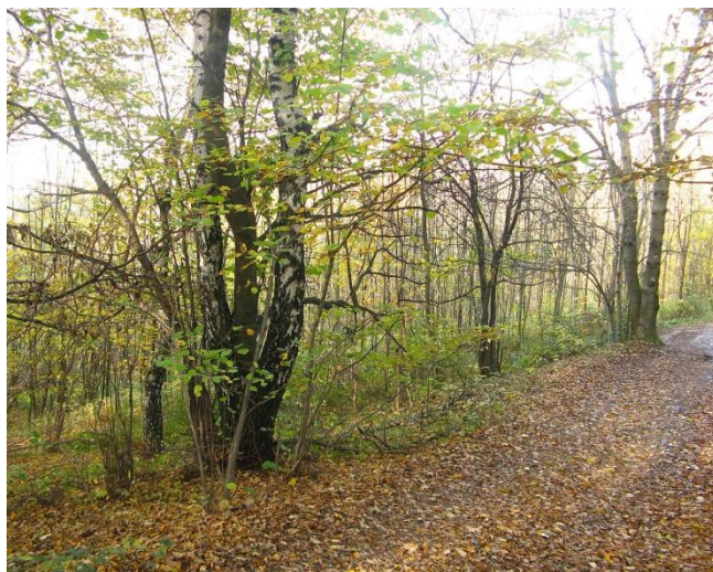
Obr. č.6: Lokalita vhodná k redukci náletu.