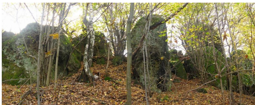
Obr. č.7: Skalky na Skalném při turistické trase (vhodné odclonit).