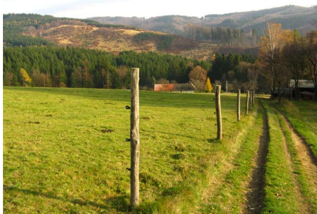
Obr. č.4: Vhodné doplnění zeleně při polní cestě.