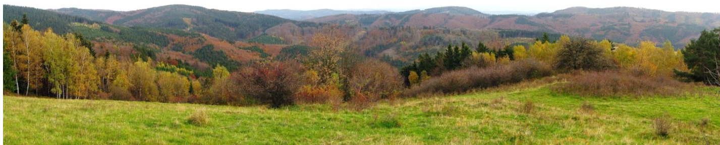
Obr. č.13: Pohled z Pardusu na centrální lesnatou část Hostýnských vrchů.