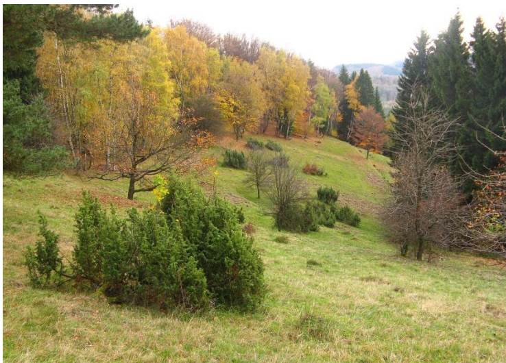
Obr. č.5: Lokalita po redukce náletu (VKP Pastvina na SV hřebenu Pardusu).