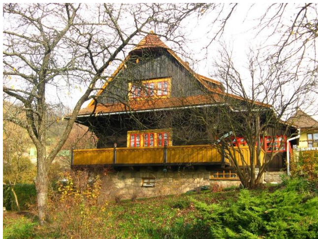
Obr. č 2: Kašparova vila (nemovitá kulturní památka).