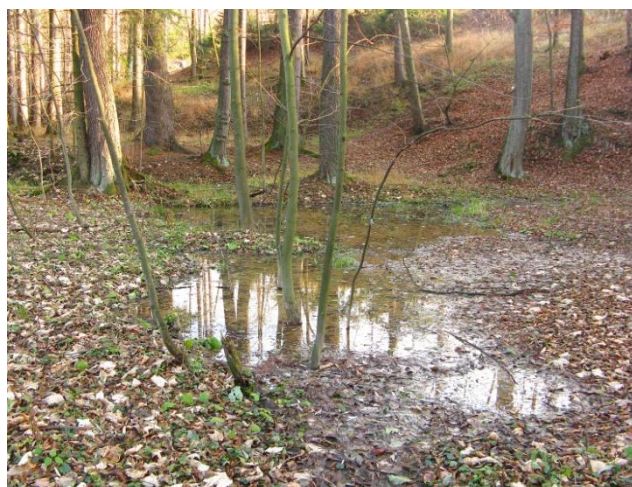
Obr. č.11: Prostor pro vybudování tůň při Ráztoce.