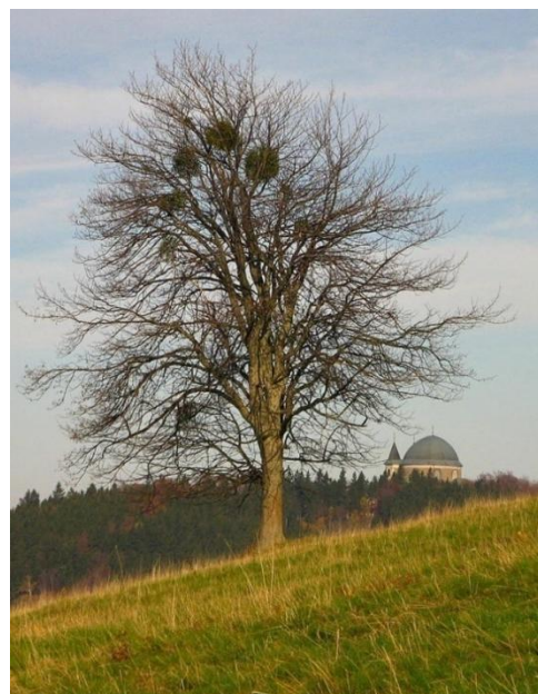
Obr. č.17: Pohled ze Skalného sv. Hostýn