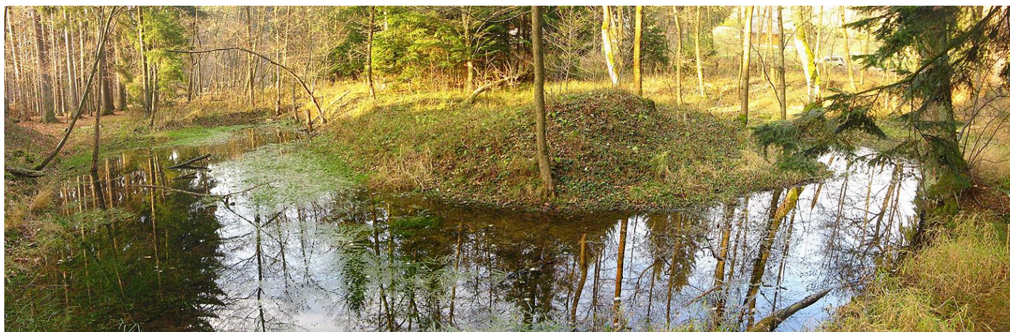
Obr. č.12: Stávající drobná vodní plocha při Ráztoce.