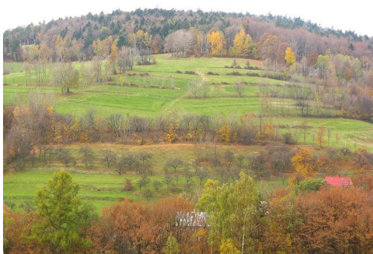
Obr. č.1: Krajinářsky hodnotné území, vhodné k doplnění vrstevnicových výsadeb.