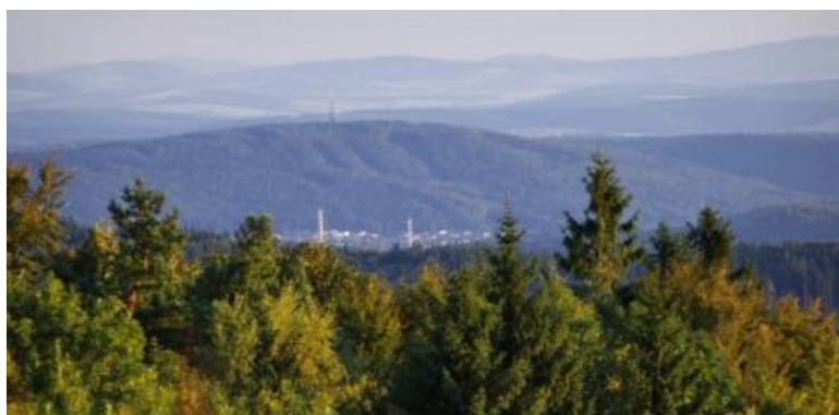
Obr. č.16: Dálkový pohled ze Skalného na Zlín a Vizovické vrchy.