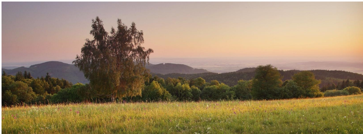
Obr. č.14: Pohled ze Skalného.