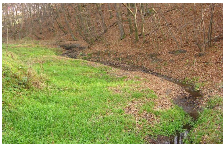
Obr. č.10: Prostor pro vybudování tůň (tůní) při Rusavě.