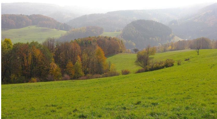
Obr. č.3: V rámci pastvin je vhodné doplnění soliterů.