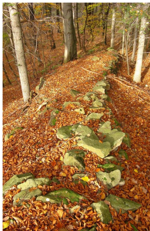
Obr. č.9: Kamenice v lesním porostu jižně od Skalného.