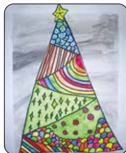
Eliška Klementová, 5. třída