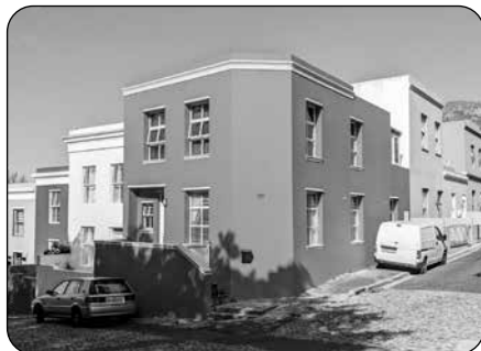
Obr. 1 Barevné domy (každý dům má jinou barvu fasády) ve čtvrti malajských obchodníků

Z přírodního hlediska je největším lákadlem města Stolová hora (obrázek 2).