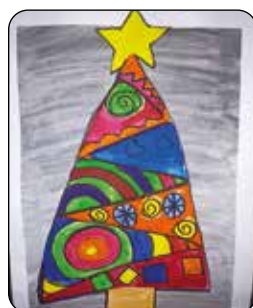
Barbora Dudláková, 5. třída