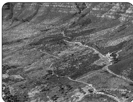
Obr. 2 Pohled na Stolovou horu tyčící se nad Kapským Městem