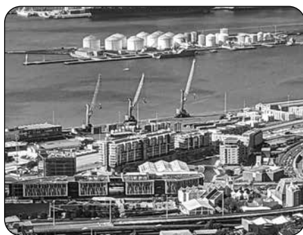
Obr. 3 Průmyslový přístav v Kapském Městě