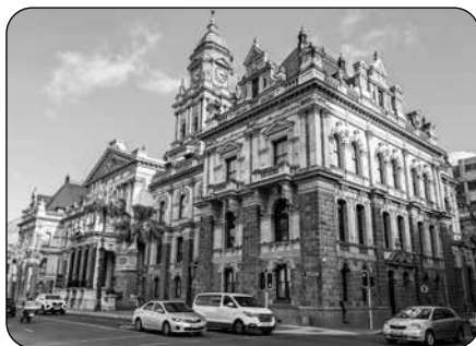
Obr. 2 – Sídlo parlamentu v Kapském Městě.