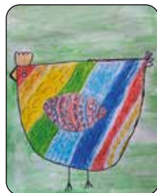
Ladislav Hrubý, 3. tř.