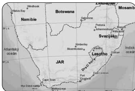
Obr. 1 – Geografická lokalizace JAR.

Na území JAR byly objeveny fosilní pozůstatky předchůdců člověka staré několik milionů let. Ty zahrnují druh Australopithecus africanus , ale také člověka zručného, vzpřímeného a moudrého. Prvním Evropanem v oblasti byl portugalský kapitán Bartolomeu Dias, který jako první obeplul nejjihujišší bod Afriky a který až při zpáteční cestě pojme-