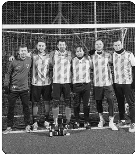
Vítězný tým RK KAFKI Přerov