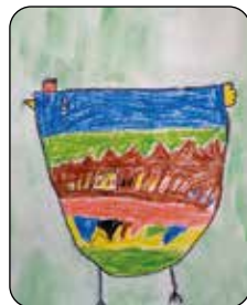
Eliáš Pavelka, 1. tř.