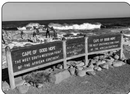
Obr. 3 – Mys Dobré naděje.